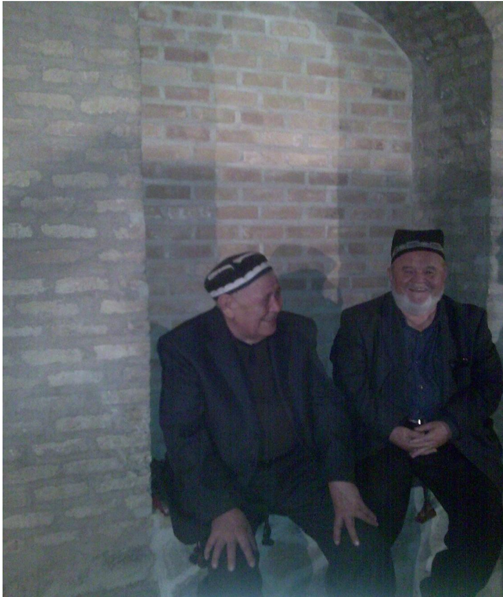
Heratda, Iskandar Qalasinda, foto manimdir Fotolar Kabilda, Heratda va Andicada çekilmiştir.