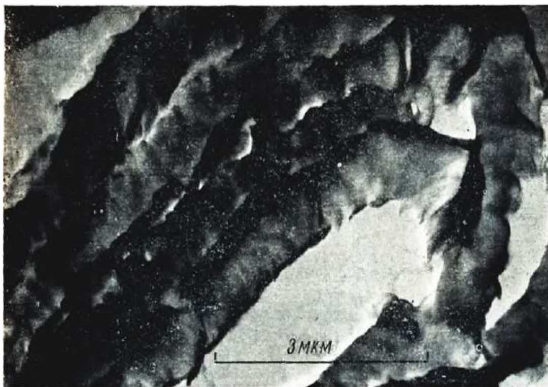
1.2.1–расм. 20 кунлик тола иккиламчи девори микрофибрилл қатламлари структураси