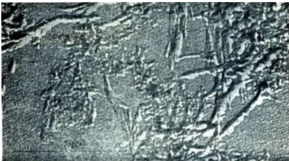
1.2.3.– расм. 100 кунлик пахта целлюлозанинг микрофибрилл “кристаллитлари” нинг энг зич соҳалари

Тола шакилланиши бўйича унинг фибрилляр структураси мукаммаллашади: структуравий элементлар ўзаро тартибланишида тахлам зичлиги ошади. Бундай манзара 50 кунликкача кузатилади, сўнгра ёруғлик ва об – ҳаво таъсирида фибрилляр структуранинг айрим бузилишлари содир бўлади, бунда пахта қуёшдан қанча узоқда турса, толанинг юпқа структурасининг тартибсизланиш самараси шунчалик катта бўлади. Бир вақтда целлюлозанинг кимёвий тузилиши ҳам рўй бериши мумкин. Бу ҳақда 100 кунлик пахта толасида намоён бўлган целлюлоза кристаллитлари микрофотографияси гувоҳлик беради (1.2.3. – расм ). Қуёш нурлари ва ҳаво кислороди ( ёруғлик-ҳаво ) таъсирида деструкция бўлганлиги аниқ кўриниб турибди.