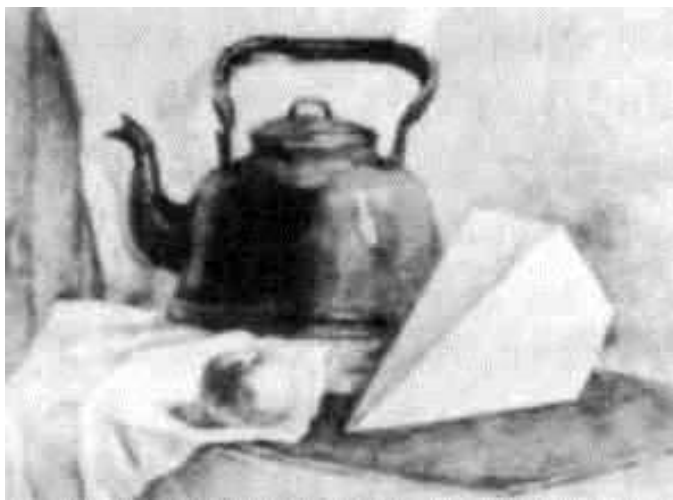
Gipsli geometrik shakllardan va unga o`xshash maishiy buyumlardan natyurmort

Tasvir qalamda puxta bajarilgach, har bir narsa va buyumning materialligi, uning hajmi, tus munosabatlari ranglar vositasida hal qilishga o`tiladi. Realistik qalamtasvirning bunday sifatlariga har bir narsalardagi (shula, yorug`lik, yarim soya, soya va h.k.) soya-yorug`lik gradatsiyasi va ularning ranglardagi o`zaro tusli